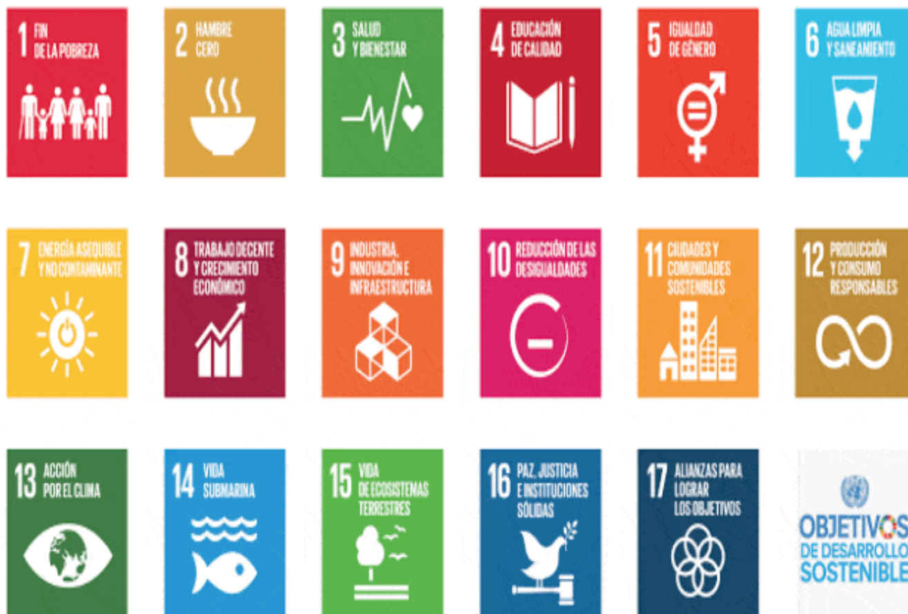
Figura # 1: Objetivos de Desarrollo Sostenido (ODS) según la ONU.