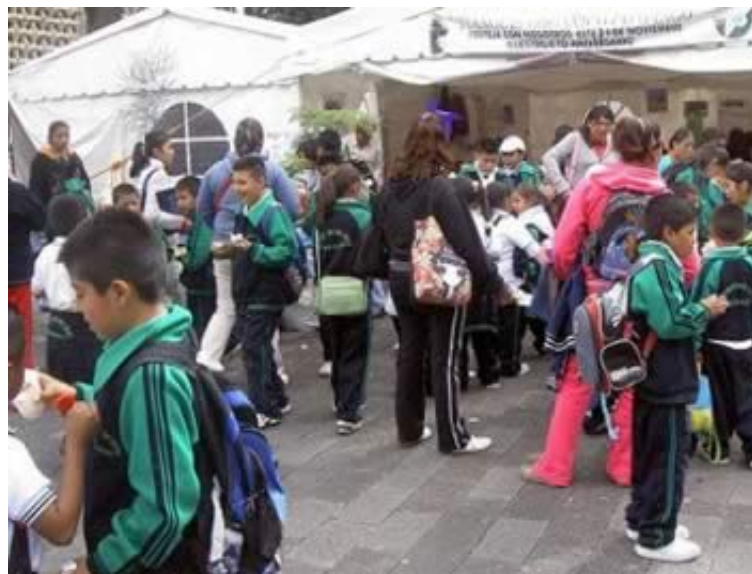
Foto 1: Los productores y promotores del Tianguis Orgánico Chapingo atienden a 5,000 joven durante la semana de Ciencia y Tecnología, 26 al 30.10.2009

Desde su surgimiento, la REDAC ha participado en la formulación y el desarrollo de políticas hacia el sector orgánico de México en su conjunto. Ejemplo de ello, es la activa participación en el proceso de la formulación de la Ley de Productos Orgánicos (aprobada en febrero de 2006), y en lo particular en su Artículo 24 que se refiere a la Certificación Participativa. Entre septiembre y diciembre de 2009 muchos integrantes de la red, académicos y productores, participan en la formulación de los Lineamientos Técnicos de la Producción Orgánica (Norma Nacional) dentro del Convenio que firmaron el SENASICA[7] y la Universidad Autónoma Chapingo.[8]