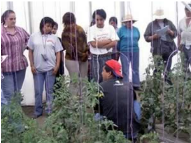
Foto 2: Visita de acompañamiento a productores de jitomate en invernadero. Las personas con libreta son del Comité de Certificación

La certificación orgánica participativa se instrumenta de la siguiente manera: